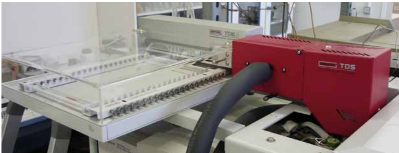
TDSA/TDS-GC/MS-System des UFZ zur automatisierten Desorption und Analyse von 20 Twistern. Für die automatisierte Analyse von bis zu 196 Twistern empfiehlt sich die ThermalDesorptionUnit (TDU) in Verbindung mit dem MultiPurposeSampler (MPS).