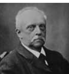
Hermann von Helmholtz